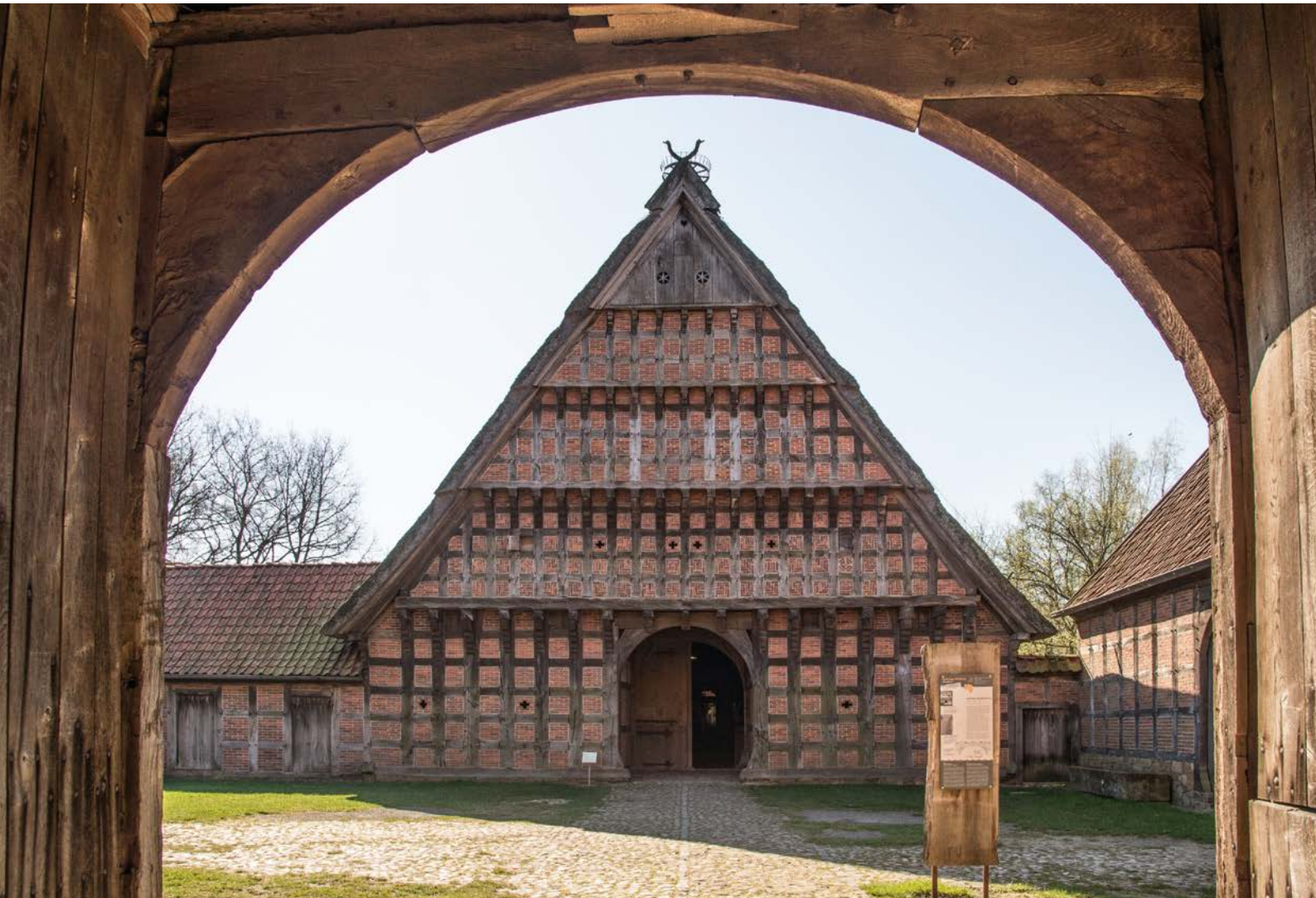
Hofanlage Wehlburg aus Wehdel, erbaut 1750.