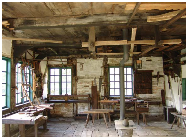
Werkstatt der Zimmerei Lürding aus Andorf, erbaut um 1840.