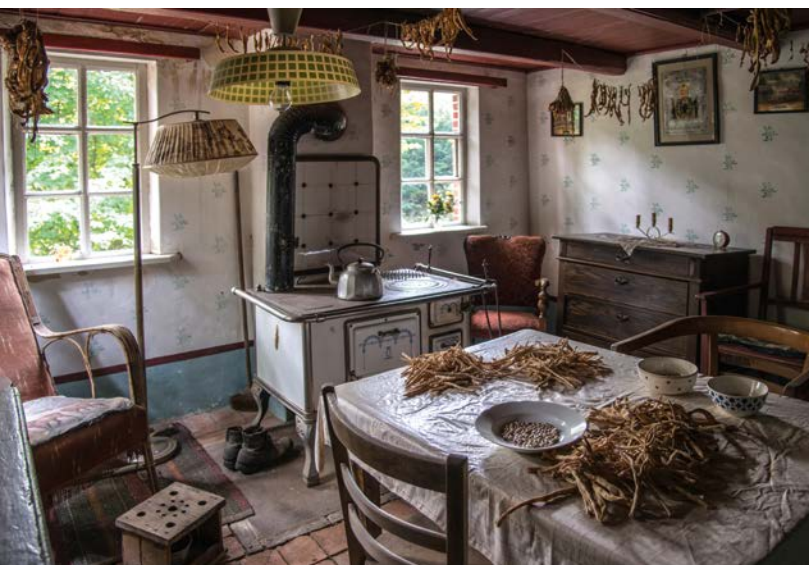
Wohnraum im Landarbeiterhaus aus Stapelmoorerheide, erbaut in der zweiten Hälfte des 19. Jahrhunderts.