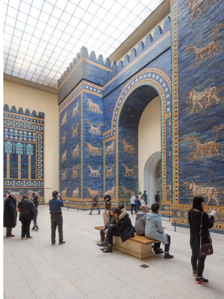
Ishtar-Tor, Rekonstruktion des äußeren Tores, 6. Jh. v. Chr., Pergamonmuseum, Museumsinsel Berlin